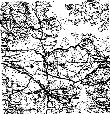
ΑΠΟΣΠΑΣΜΑ ΧΑΡΤΗ ΠΕΡΙΦΕΡΕΙΑΣ ΚΟΙΝΟΤΗΤΑΣ ΚΕΡΑΜΙΔΙΑΣ κλίμακα 1:50000 ΟΡΙΟΣΤΡΑΤΗ Έκτασης που κλήθηκε

Αμαλιάδα Σεπτέμβριος 1993 Ο Συντάκτης Ο Δασάρχης αα Γ. Παρασκευάσπουλος Διον. Θωρόπουλος Τεχνικός Διακόσιος Δασολόγος Γε Α' ε.